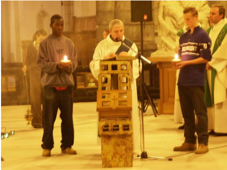
foto 2.8 de diaken of de priester leest het evangelie voor, vergezeld van licht en wierook.

Uit vreugde voor de boodschap die we van de Heer hebben gekregen, zingen we na het evangelie het Alleluja (<Hebr. "Loof de Heer").