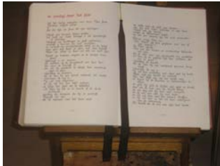
foto 2.1 het evangelieboek

Na het openingsgebed gaat iedereen zitten om te luisteren naar de lezingen uit de Schrift.