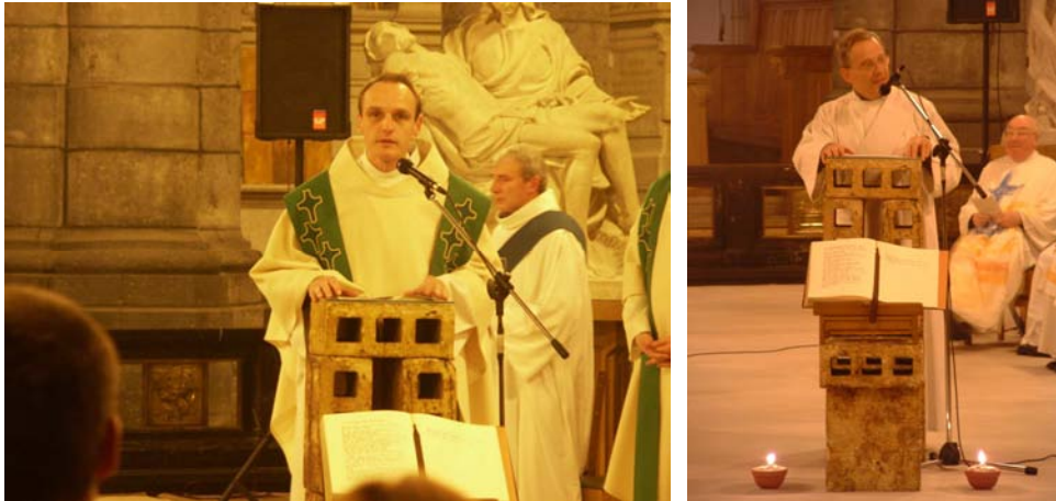
foto 2.9, 2.10: de priester of diaken probeert de lezingen te hertalen naar onze tijd in de homilie.

Daarom probeert de priester of diaken de lezingen te hertalen naar onze tijd en er de betekenis voor ons uit te halen. De homilie of preek is dus een soort actualisering van de boodschap van God uit de eerste lezing en het evangelie.