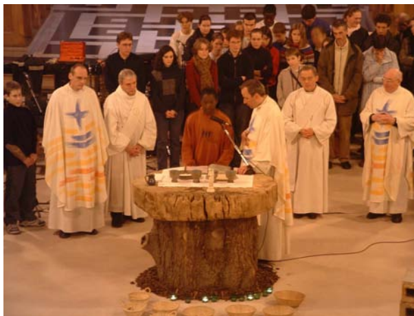
foto 3.7: een jongere leest een gebed voor dat geschreven werd in de jeugd- en jongerenwerking.

Vervolgens bidden we ook voor de Kerk, de eigen gemeenschap, de noden in de wereld en de overledenen. We bidden dit alles in verbondenheid met de hele gemeenschap van de heiligen: de Maagd Maria, de engel Michaël en alle engelen en heiligen. Hemel en aarde zijn hier intens verbonden.