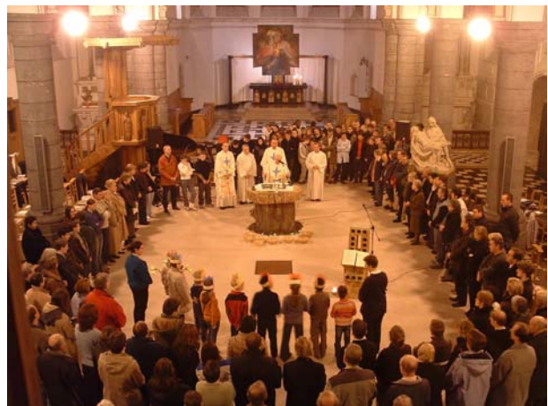
foto 3.5: tijdens het eucharistisch gebed staan we in een kring rond het altaar.