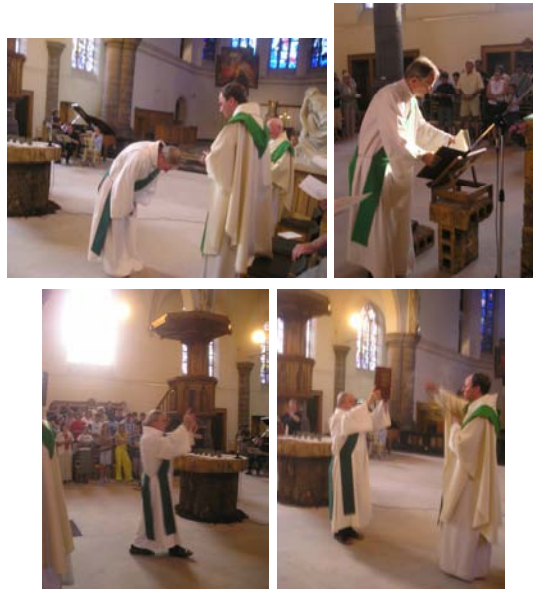
foto 2.3, foto 2.4, foto 2.5 en foto 2.6 de diaken maakt zich klaar om het evangelie voor te lezen en wordt daartoe gezegend.

Ondertussen wordt het evangelieboek door de diaken aangebracht. Omdat dit boek symbool staat voor Christus, wordt het vereerd met wierook. De gemeenschap staat recht om zich voor te bereiden op het hoogtepunt van de Woorddienst.