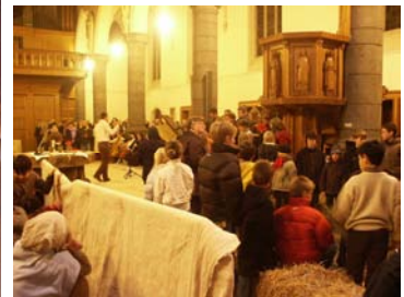
foto 4.6, foto 4.7, foto 4.8, foto 4.9, foto 4.10, foto 4.11: Jongeren ontmoeten elkaar in de kerk, de gang, de jongerenbar of de tuin.

Kom gerust eens langs: elke zaterdagavond om 19u30 Sint-Michielskerk, Kortrijk.