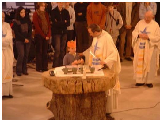
fig. 3.10: een kind leest het vredesgebed voor.

Nadat we gebeden hebben om de bevrijding van al onze fouten en de komst van Gods koninkrijk in ons en in de hele wereld, bidden we om de vrede van Jezus. We wensen elkaar allemaal die vrede toe, een vrede die we mogen ervaren als Gods wil werkelijkheid wordt – iets waarvoor we net gebeden hebben in het “Onze Vader”. Het is ook een teken van verzoening en liefde wanneer we elkaar de hand geven en alle goeds toewensen. Zo zijn we innerlijk gezuiverd van alle kwaad, vooraleer we ons met Jezus zelf verenigen.